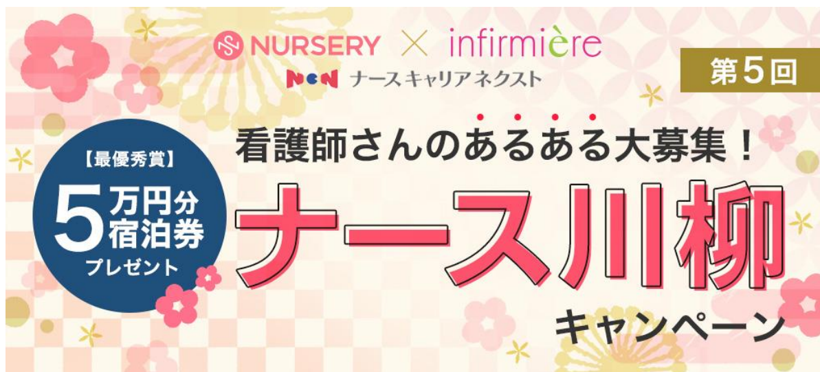
<看護の日応援>最大5万円分の宿泊券プレゼント！「ナース川柳」キャンペーン

株式会社ベルーナ（本社：埼玉県上尾市、代表取締役社長：安野 清）の子会社である株式会社ナースステージ（ https://www.nursestage.co.jp ）の看護師向け通販ブランド「アンファミエ」（ https://www.infirmiere.co.jp/ ）と「ナースリー」（ https://www.nursery.co.jp/ ）、看護師の人材紹介事業「ナースキャリアネクスト」（ https://career-next.jp/ ）は、5月12日の「看護の日」を記念して、『<看護の日応援>最大5万円分の宿泊券プレゼント！第5回「ナース川柳」キャンペーン』を3月10日から実施いたします。