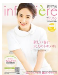
<アンファミエ春号>