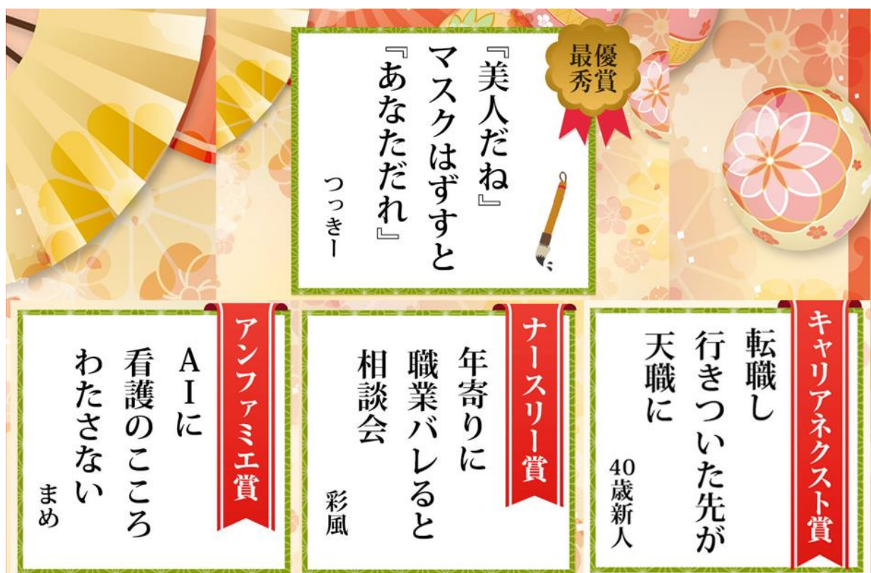
<第4回 「ナース川柳」受賞作品>