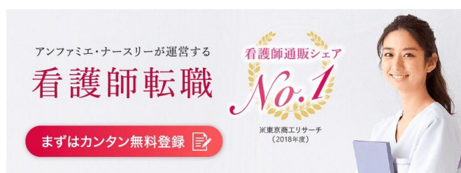
<ナースキャリアネクスト サイト>