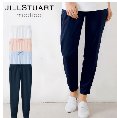
スクラブパンツ : 4 サイズ 価格 : 5,940 円(税込) 素材 : アスレジャージ