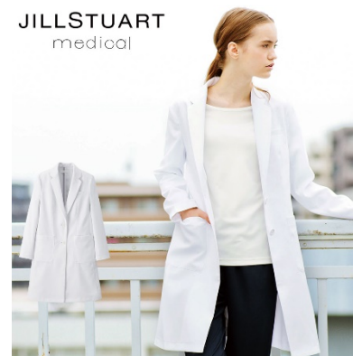
ドクターコート : 4 サイズ 価格 : 9,612 円(税込) 素材 : ダイアゴナル