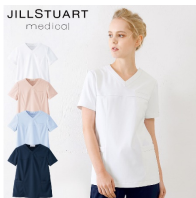
スクラブ : 4 サイズ 価格 : 6,372 円(税込) 素材 : アスレジャージ