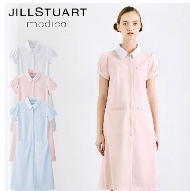
ワンピース : 4 サイズ 価格 : 8,532 円(税込) 素材 : コードストライプ