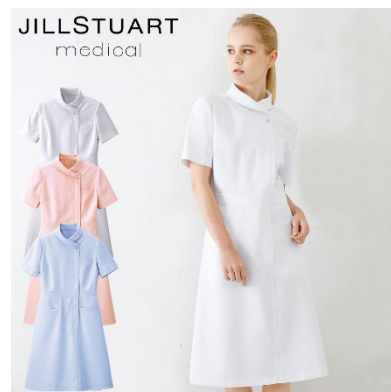
ワンピース : 4 サイズ 価格 : 8,532 円(税込) 素材 : ダイアゴナル