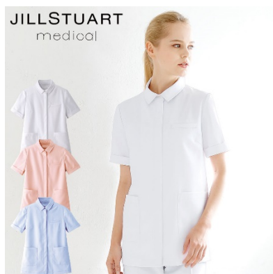
ジャケット : 4 サイズ 価格 : 7,452 円(税込) 素材 : ダイアゴナル