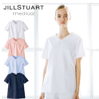
スクラブ : 4 サイズ 価格 : 6,372 円(税込) 素材 : ダイアゴナル