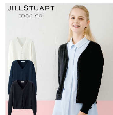
カーディガン : 4 サイズ 価格 : 5,292 円(税込) 素材 : 綿混ニット