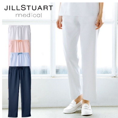
パンツ : 4 サイズ 価格 : 5,940 円(税込) 素材 : ダイアゴナル